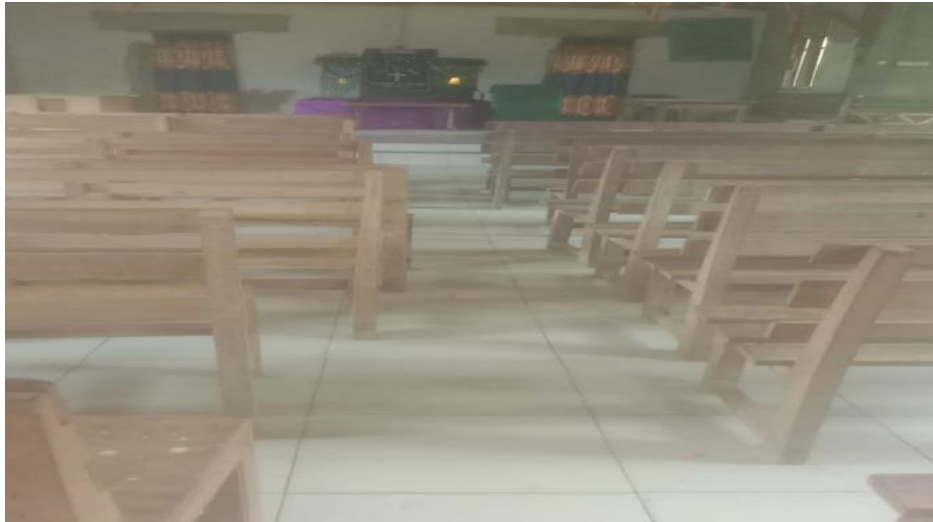
Gambar 3. Gedung Gereja Jemaat Hermon Panampo

Gedung gereja yang belum relevan bagi penyandang disabilitas ini perlu dikritisi karena belum mencerminkan nilai keramahtamahan atau keramahtamahan teologis, liturgi yang ramah seharusnya menyediakan ruang fisik yang memungkinkan penyandang disabilitas duduk dengan nyaman dan aman tanpa merasa terpinggirkan. Ketiadaan kursi khusus dan ruang gerak yang cukup menempatkan mereka hanya sebagai "tamu", padahal mereka adalah bagian dari citra Allah ( Imago Dei ) yang berhak atas partisipasi penuh.